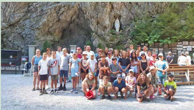
Tout le groupe a vécu la messe à la grotte de Grandvillard.