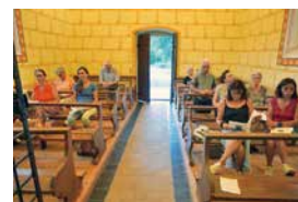
À Montban, nous avons vécu un vrai moment d'union et de partage.

L'année prochaine, venez nombreux prier avec nous !