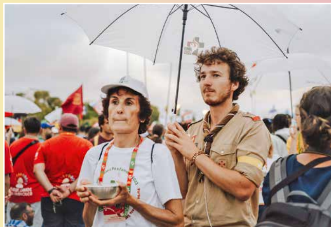
Les scouts au service des participants.

DB: Nous avons toujours été accueillis très chaleureusement. Sans même nous connaître, nos hôtes nous proposaient tout ce qu'ils avaient de mieux. Leur