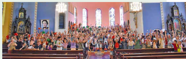
La joie des servants remplit l'église de Siviriez.