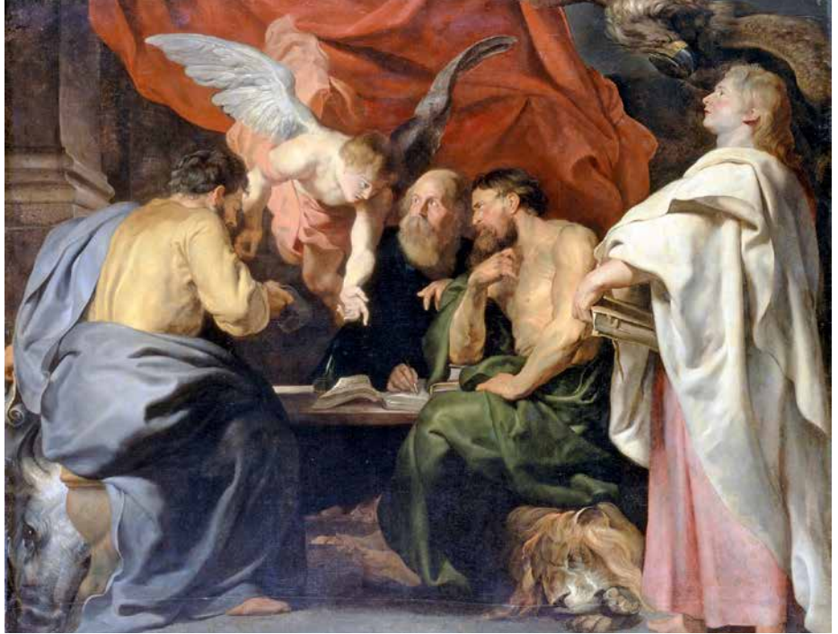
Les auteurs du Nouveau Testament représentés par Rubens.

Situer les auteurs des écrits du Nouveau Testament permet d'entrer plus profondément dans leur intelligence.