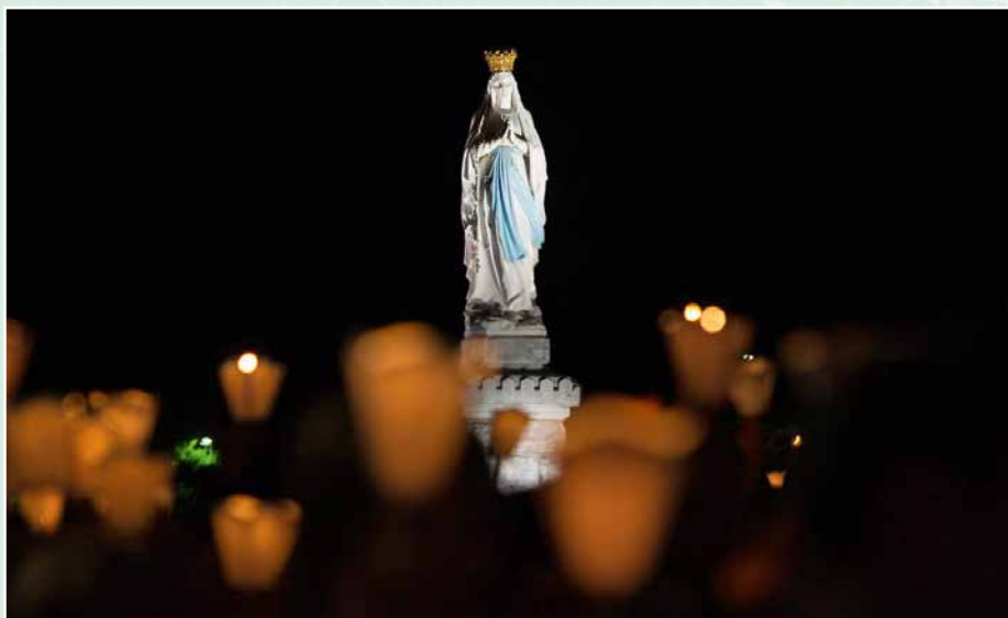
Lorsqu'on marche avec Marie, sa lumière nous accompagne.

Renseignements: lgf@pelerinagelourdes.ch