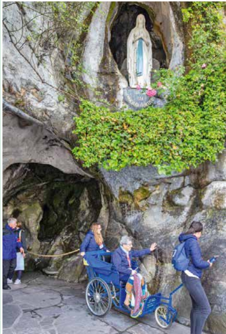
Toucher la grotte fait ressentir une émotion bienfaisante.

priez Dieu pour les pécheurs. Allez baiser la terre pour la conversion des pécheurs.» «Allez boire à la fontaine et vous y laver. Vous mangerez de cette herbe-là.» «Allez dire aux prêtres qu'on vienne ici en procession ; qu'on y bâtit une chapelle.» «Je suis l'Immaculée Conception.»