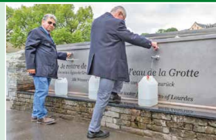
Ramener de l'eau de Lourdes démontre combien les pèlerins pensent à ceux qui sont restés