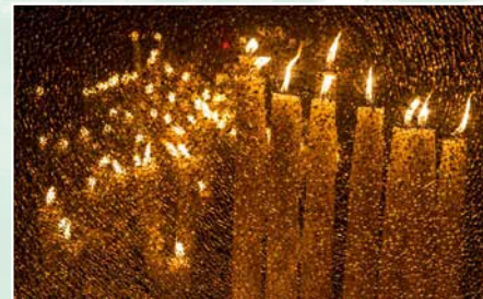
Une flamme vibrante porte nos prières à Dieu et à Marie.

Alors, Lourdes, une expérience à vivre... oseras-tu risquer l'aventure ?