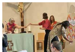
L'équipe pastorale construit ensemble le panneau : « Tous unis dans le corps du Christ. »

TEXTET ET PHOTO PAR CHRISTINE ANDREY-MÜLLER