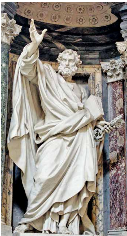
Les épîtres de Pierre sont rattachées au premier des apôtres.