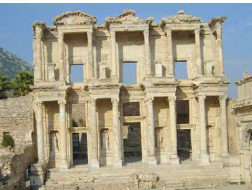
La rédaction du milieu du quatrième évangile est située généralement dans la ville d'Ephèse en Asie Mineure.

Le Christ est venu accomplir et non abolir la Torah (5, 17-19). Il propose les cinq discours du nouveau Pentateuque (les cinq rouleaux de la Loi): le sermon sur la montagne (5-7); celui de la mission (10); des paraboles (13); de la communauté (18); et de la fin des temps (24-25). Pour un juif devenu chrétien, c'est porter sa propre tradition à son abou-